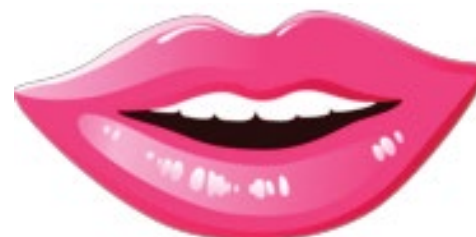
«Губы Моны Лизы»

Косметологическая клиника «Баден-Баден Премиум». Екатеринбург, Бажова, 73